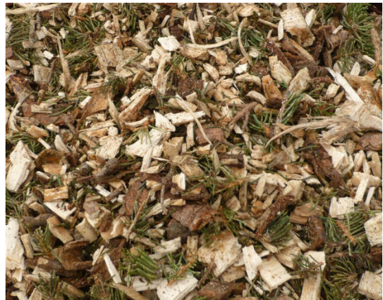
[P45W50 aus Fichtenstarkholzkronen]

Es muss darauf geachtet werden dass nicht zu viel Feinreisig bzw. Laub mit in das Hackgut gelangt, da ansonsten auch hier Verschlackungsprobleme auftreten, und der Heizwert gemindert wird. Außerdem besteht bei Waldhackschnitzeln die Problematik der Trocknung. Grundsätzlich gilt: je Trockener desto besser!