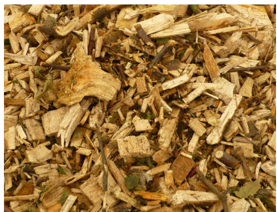
[P45W50 aus Landschaftspflegeholz]

Für kleine und Mittlere Heizanlagen ist Landschaftspflegeholz Prinzipiell eher ungeeignet, da es einen sehr hohen Aschegehalt und einen niedrigen Heizwert hat, sowie zur Verschlackung im Kessel neigt.(Hoher Rinden- und Laubgehalt).