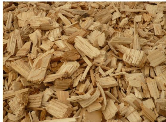
[P45W20 aus Nadel-Vollholz]

Von der Wärmeausbeute sowie der Anlagentechnik her betrachtet sind Vollholzhackschnitzel mit Wassergehalten unter 20% die beste Wahl. Sie sind zwar in der Beschaffung pro Volumeneinheit deutlich teuer als die anderen Sorten, garantieren aber hohe Wärmeausbeute, Zuverlässigen Anlagenbetrieb, und niedrige Aschegehalte, sowie Emissionen.